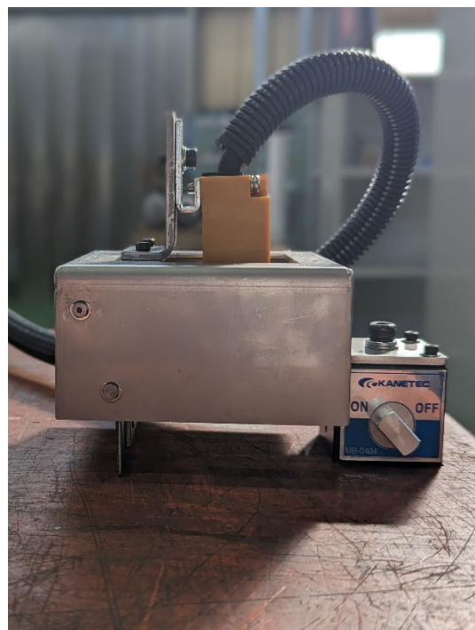
接触停止センサー